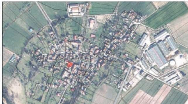
Grundstücke (rot markierte Fläche) 526 m 2

Nutzungsart: Gebäude- und Freifläche, Wohnen